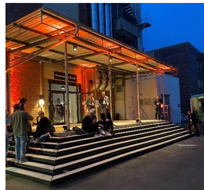
2 Das Zentrum für Kunst als Treffpunkt für freischaffende Künstler:innen

Das Zentrum für Kunst im Tabakquartier ist seit 2023 im Bremer Stadtteil Woltmershausen ein neuer Kulturstandort, der explizit für die Freie Kunstszene vom Senator für Kultur betrieben wird. Professionelles Arbeiten unter besten Voraussetzungen für staatlich nicht gebundene Tänzer:innen, Schauspieler:innen, Musiker:innen und Bildende Künstler:innen wird in Probenräumen, Veranstaltungssälen, Ateliers und einem Tonstudio auf 5.500 qm möglich. Die künstlerisch tätigen Menschen können sich hier ausprobieren, vernetzen, qualifizieren und weiterentwickeln. Interdisziplinarität und spartenübergreifendes Arbeiten zwischen den Künstler:innen vor Ort ist ein grundlegendes Ziel des Zentrums für Kunst. In direkter Nachbarschaft befinden sich der neue Standort der Bremer Philharmoniker und das Boulevard-Theater Bremen.