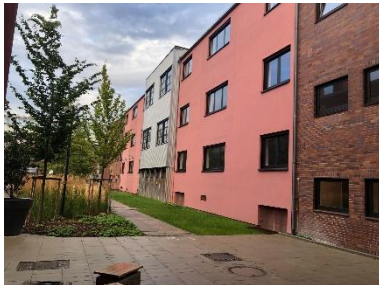
1 Freie Wände für die Kunst: West-Fassade des Zentrums für Kunst zum Innenhof

Für die Gestaltung der zum Innenhof zeigenden Westfassade des Zentrums für Kunst im Bremer Tabakquartier wird ein zweistufiger künstlerischer Wettbewerb ausgeschrieben.